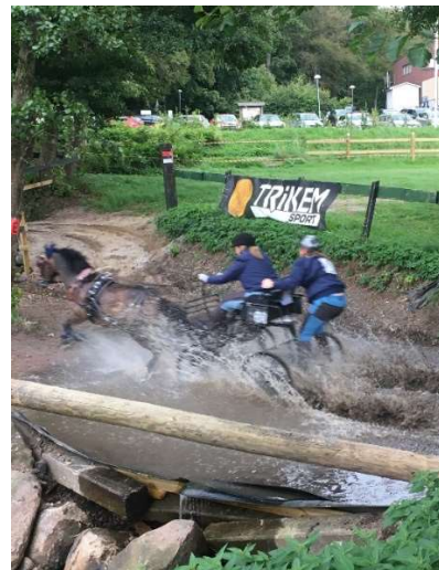
Fartfyllda ekipage från Laholms RF

För att följa körtävlingar rekommenderas webbplatsen horsedriving.nu